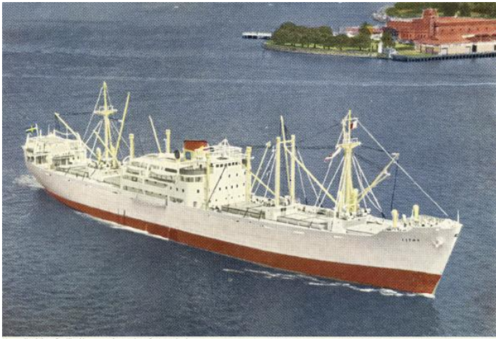
Australia West Pacific Line vessel entering Sydney harbour. Citos Maru