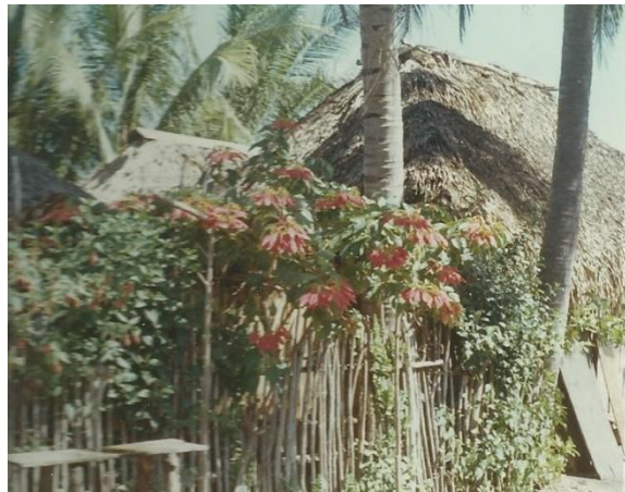
Kan detta ha varit författarens bar?

Dom hade varit där förr, men för mej var det första anlöpet till denna gudsförgätna håla.